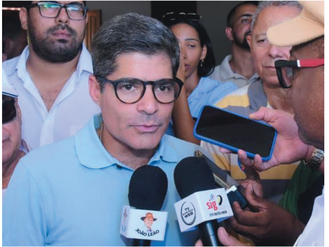
Ex-prefeito ACM Neto em coletiva de imprensa na cidade de Barra, no oeste da Bahia

tos municípios por questões eminentemente políticas. Muitas promessas já foram feitas e os prefeitos perceberam que não vão ser realizadas. Em outros casos, simplesmente viram as costas e tratam como se o município não fosse da Bahia”, criticou ACM Neto, durante entrevista coletiva.